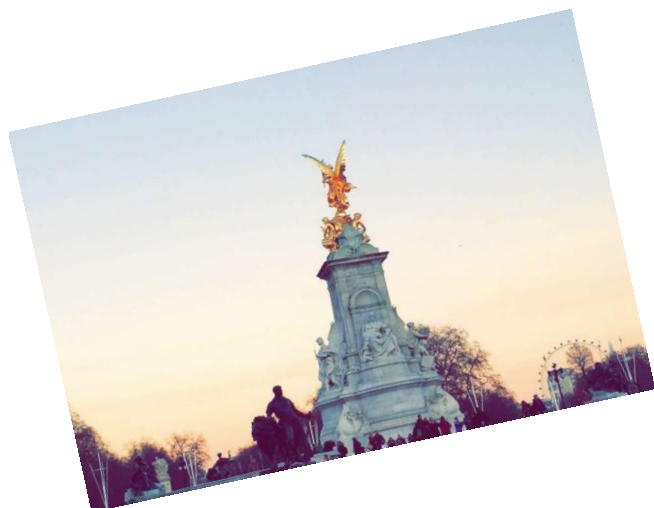
La place en face de Buckingham Palace