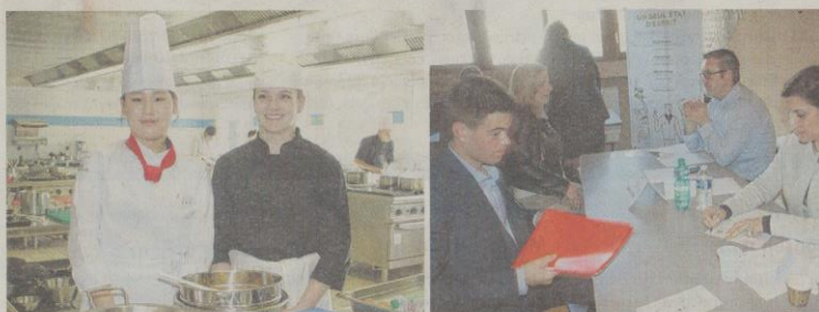
A gauche : duo franco-coréen en cuisine. À droite : 400 jeunes ont rencontré des recruteurs

Dans le parc du château, producteurs et marchands locaux ont fait découvrir des denrées alimentaires et des boissons au public. Le stand de la Corée du Sud a bien évidemment attiré les curieux. Une délégation du lycée partenaire Sangsuh, de Daegu, était arrivée la veille - lire notre édition d'hier jeudi.